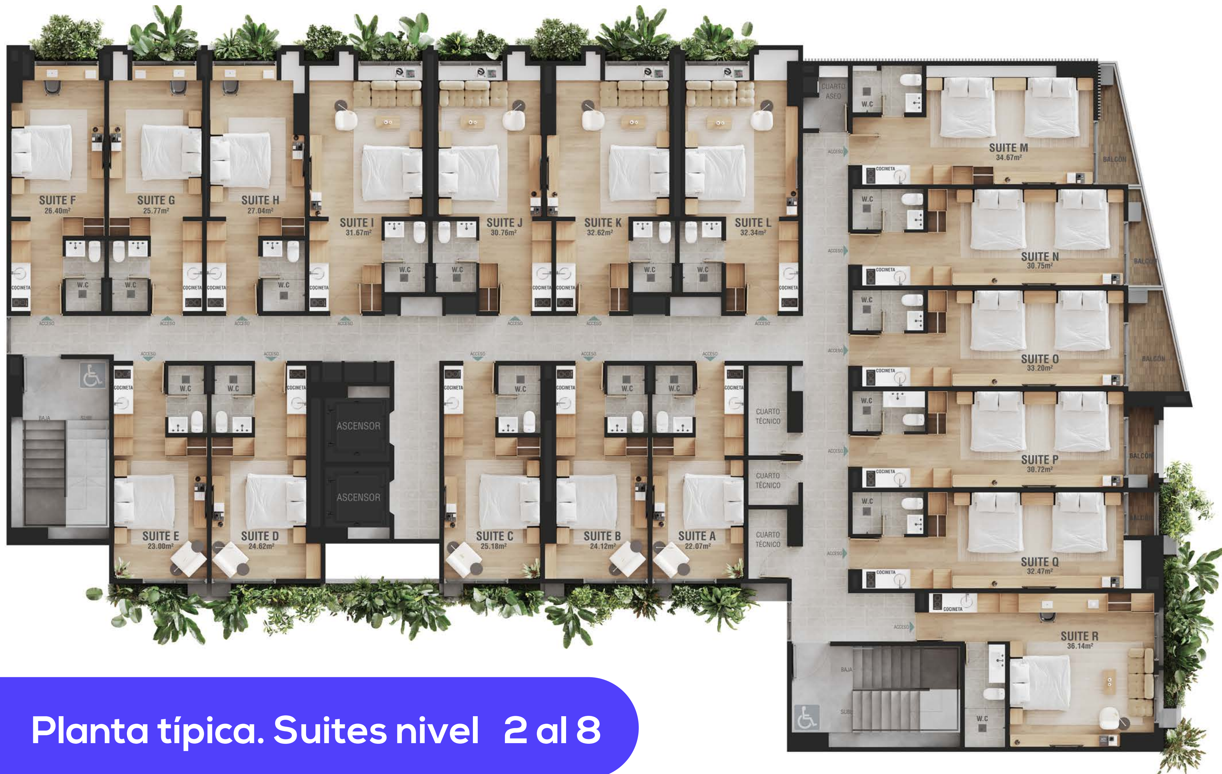
Planta típica. Suites nivel 2 al 8